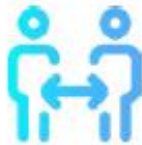
GARDEZ EN TOUT TEMPS UNE DISTANCE D'AU MOINS 2 MÈTRES AVEC LES AUTRES PARTICIPANTS