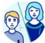
ÉVITEZ LES CONTACTS AVEC LES PERSONNES INFECTÉES