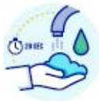
LAVEZ-VOUS LES MAINS RÉGULIÈREMENT