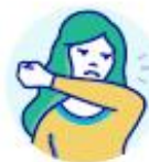
TOUSSEZ/ÉTERNUEZ DANS VOTRE COUDE