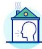
ISOLEZ-VOUS EN CAS D'APPARITION DE SYMPTÔMES