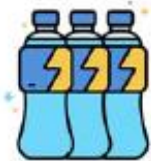
MINIMISEZ LE PARTAGE DE MATÉRIEL (COMME LES BOUEILLES)